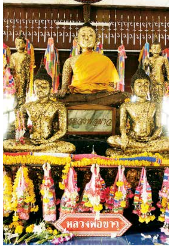
วัดนครธรรม

พระสยามเทวาธิราชจำลอง อยู่หน้าสถานีตำรวจภูธรอำเภออรัญประเทศ เป็นรูปจำลองพระสยามเทวาธิราช มีความสูง ๑.๒๙ เมตร สร้างโดยพระอุทัยธรรมธำ เจ้าอาวาสวัดป่ามะไฟ เมื่อ พ.ศ. ๒๕๑๘ ต่อมาราษฎรได้ร่วมกันสร้างบุษบกเป็นที่ประทับ โดย