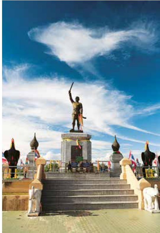
พระบรมราชานุสาวรีย์สมเด็จพระนเรศวรมหาราช

การเดินทาง จากกรุงเทพฯ สามารถใช้เส้นทางได้ ๓ เส้นทาง ได้แก่ ๑. ใช้ทางหลวงหมายเลข ๓๐๕ สายรังสิต-นครนายก ๒. ใช้ทางหลวงหมายเลข ๓๓