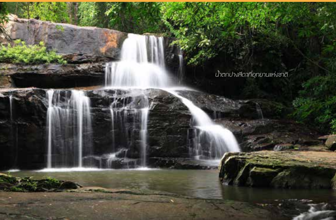
น้ำตกปางสีดาที่อุทยานแห่งชาติ

พื้นที่ความรับผิดชอบ : นครนายก ปราจีนบุรี และสระแก้ว