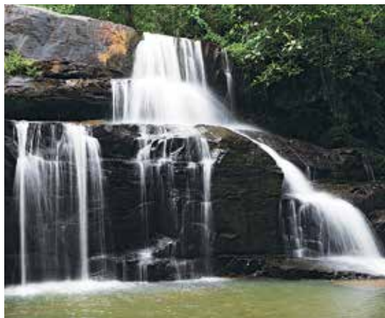
น้ำตกปางสีดา

ช่วยพัฒนาจัดตั้งขึ้นเป็นโรงเรียนฝึกกระบือเพื่อช่วยในการทำเกษตรกรรมแบบดั้งเดิม พื้นที่โรงเรียน ๑๑๐ ไร่ ๓ งาน ๘๑ ตารางวา แบ่งกิจกรรมออกเป็น ๗ ส่วน ประกอบด้วย การอบรมเกษตรกรและการฝึกกระบือนิทรศาสตร์ เครื่องมือการทำนา แปลงนาหญ้า อาหารสัตว์ บ้านพักนักปราชญ์ท้องถิ่น สระมะรุ้ม ล้อมรั้ว ต้นไม้ในโรงเรียนกาสรกสิวิทย์ ร้านควายคานอง คอกควาย สูดท้ายเป็นบ้านดิน ซึ่งเป็นที่พักของผู้เข้ารับการอบรมและเป็นต้นแบบที่อยู่อาศัยจริง สอบถามข้อมูลเพิ่มเติมได้ที่ โทร. ๐๘ ๘๕๒๔ ๗๗๕๕, ๐๘ ๖๐๔๕ ๒๔๖๓ (มีบริการห้องสุขาและทางลาดสำหรับผู้พิการ)