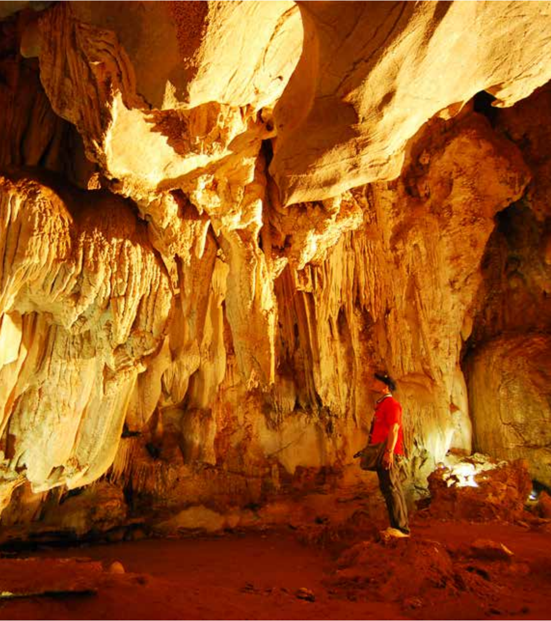
ถ้ำเพชรหาดทรายแก้ว