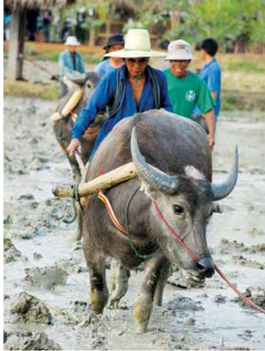
โรงเรียนเกษตรศึกษา

ศาลหลักเมือง ตั้งอยู่บนเส้นทางหลวงหมายเลข ๓๓ จากตัวเมืองไปทางอำเภอดงเจริญ ๔ กิโลเมตรทางซ้ายมือ ณ บริเวณพลสวนกาญจนาภิเษก หมู่ที่ ๓ ตำบลท่าเกษม ศาลหลักเมืองจัดสร้างตามแบบมาตรฐานของกองสถาปัตยกรรม กรมศิลปากร เป็นปราสาทองค์ใหญ่กว้าง ๖.๖๐ เมตร สูง ๑๙.๑๐ เมตร และปรางค์ ๔ ทิศโดยรอบ ภายในศาลประดิษฐานเสาหลักเมืองซึ่งเป็นไม้ชัยพฤกษ์ที่มีคุณลักษณะต้องตามโบราณราชประเพณี ขนาดเส้นรอบวงที่โคนต้น ๑๒๐ นิ้ว สูง ๒๒๙ นิ้ว และแผ่นทองดวงเมืองที่พระบาทสมเด็จพระเจ้าอยู่หัวทรงเจิมเมื่อ