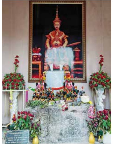
อนุสาวรีย์ลายพระหัตถ์

การเดินทาง ห่างจากตัวเมืองปราจีนบุรี ๒๐ กิโลเมตร ไปตามเส้นทางหลวงหมายเลข ๓๑๙ เมื่อถึงกิโลเมตรที่ ๑๓๐ เลี้ยวซ้ายไปตามทางหลวงหมายเลข ๓๐๗๐ อีกประมาณ ๑ กิโลเมตร เมืองศรีมโหสถจะอยู่ทางด้านขวามือ มีโบราณสถานตั้งอยู่กระจัดกระจายสามารถเข้าชมได้หลายทาง และทะลุถึงกันได้