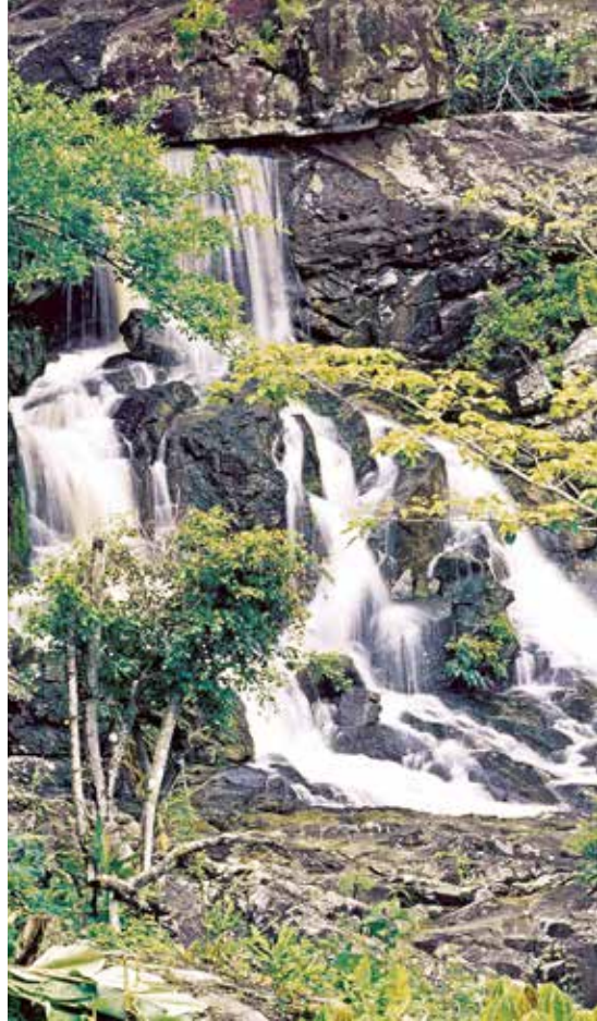
น้ำตกห้วยใหญ่

การเดินทาง แยกจากทางหลวงหมายเลข ๓๐๔ ตรงหลักกิโลเมตรที่ ๗๙ เข้าไป ๖ กิโลเมตร อยู่ในเขตอำเภอวังน้ำเขียวจังหวัดนครราชสีมา ในหน้าแล้งนำรถยนต์เข้าได้เกือบถึงตัวน้ำตก