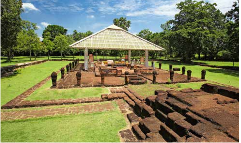
โบราณสถานสระมรกต

เมื่ออดีตเป็นสถานที่ตั้งพลับพลาที่ประทับของ รัชกาลที่ ๕ ครั้งเสด็จประพาสสมณทลปราจีนบุรี ภายในวัดบางแตนมีพิพิธภัณฑที่พื้นบ้านที่ ทรงคุณค่าซึ่งเก็บรวบรวมเครื่องมือประกอบอาชีพ ของชนบท ชมทิวทัศน์ริมฝั่งแม่น้ำปราจีนบุรี ยามเย็น