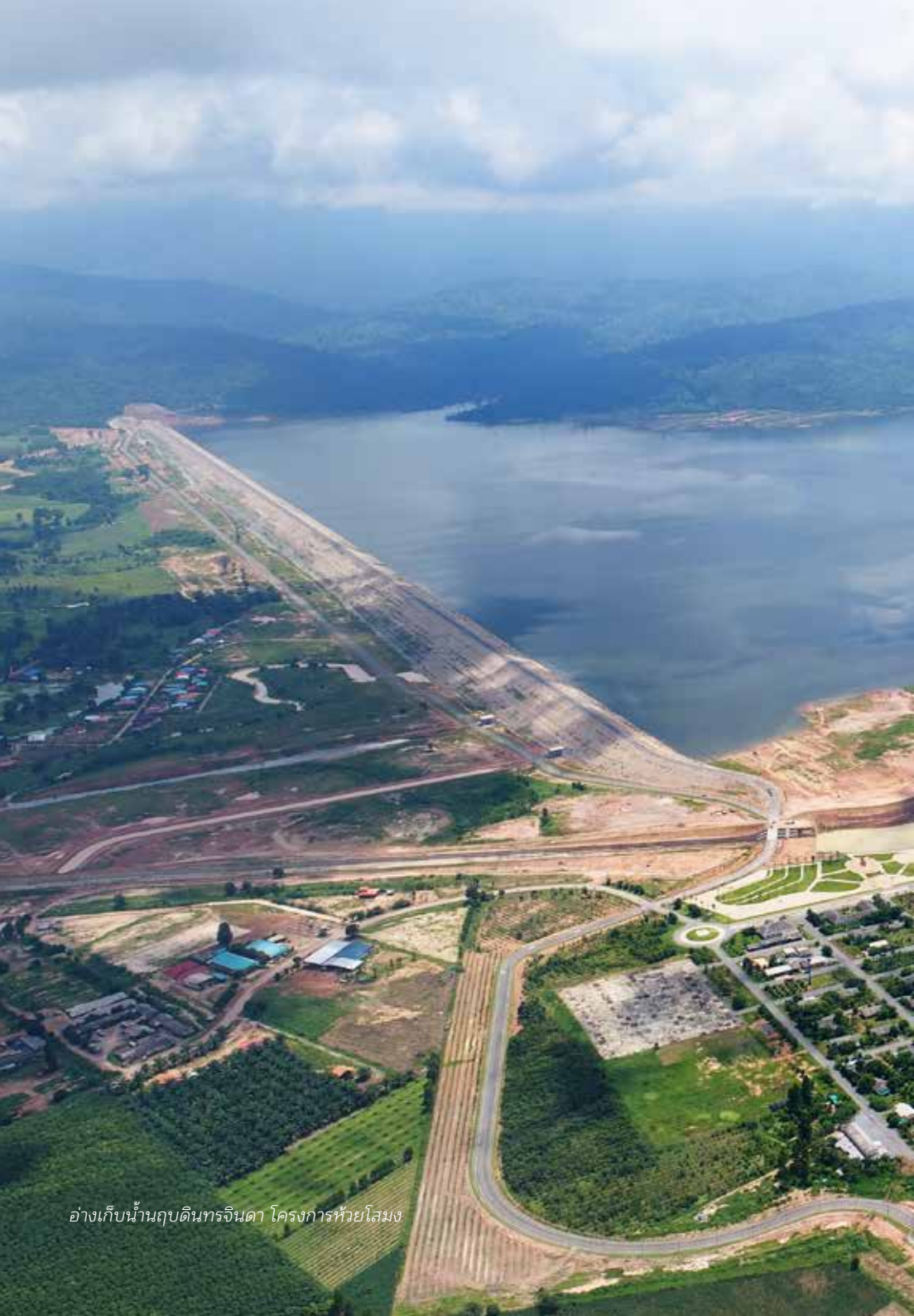
อ่างเก็บน้ำนฤปดินทราจินดา โครงการห้วยโสมง