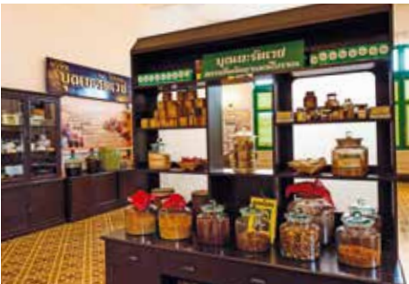
พิพิธภัณฑ์การแพทย์แผนไทยอภัยภูเบศร

แบบยุโรป สมัยเรอเนสซองส์ มีมุขด้านหน้า ตรงกลางเป็นโดม ผังด้านนอกเป็นปูนปั้นลาย พุกษาประดับซุ้มประตูและหน้าต่าง ภายใน ตกแต่งแบบตะวันตก เป็นตึกที่เจ้าพระยา ภัยภูเบศรสร้างขึ้นโดยทรัพย์สินส่วนตัว ในปี พ.ศ. ๒๔๕๒ เพื่อถวายเป็นที่ประทับแรมของ พระบาทสมเด็จพระจุลจอมเกล้าเจ้าอยู่หัว หาก เสด็จประพาสสมณทลปราจีนอีกครั้ง แต่ไม่ทัน ได้เสด็จประทับ พระองค์ก็เสด็จสวรรคตก่อน เมื่อ พ.ศ. ๒๔๕๓ อย่างไรก็ตาม ที่นี่เคยเป็น ที่ประทับของพระบาทสมเด็จพระมงกุฎเกล้า เจ้าอยู่หัว เมื่อปี พ.ศ. ๒๔๕๕ รวมทั้งพระบรม- วงศานุวงศ์อีกหลายพระองค์ คราเสด็จประพาส สมณทลปราจีนบุรี โดยที่ท่านเจ้าของตึกนี้ไม่เคยใช้ ที่นี่เป็นที่พำนักส่วนตัวเลย ตึกนี้เคยใช้เป็น ตึกอำนวยการ ภายในแบ่งออกเป็น ๒ ชั้น ชั้นล่าง เป็นห้องตรวจโรค ห้องจำหน่ายยา และห้อง ผ่าตัด ชั้นบน ใช้สำหรับรับคนไข้หญิง จนถึง ปีพ.ศ. ๒๕๑๒ ที่ตึกอำนวยการหลังปัจจุบันเสร็จ ปีพ.ศ. ๒๕๓๓ กรมศิลปากรได้ประกาศขึ้นทะเบียน ตึกเจ้าพระยาอภัยภูเบศรเป็นโบราณสถาน และ เปิดเป็นพิพิธภัณฑ์อย่างเป็นทางการเมื่อวันที่ ๒๔ มิถุนายน พ.ศ. ๒๕๓๙