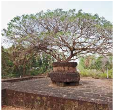
โบราณสถานพานหิน

บ้านดงกระต่าย เป็นชุมชนที่เก่าแก่ ตั้งอยู่ที่อำเภอศรีมหาโพธิ์ จังหวัดปราจีนบุรี ประชากรส่วนใหญ่มีเชื้อสายชาวพวนอพยพมาจากทางนครเวียงจันทน์ตั้งแต่ราวสมัยต้นกรุงรัตนโกสินทร์ มีวิถีชีวิตและวัฒนธรรมที่เป็นเอกลักษณ์ของตนเอง เช่นการทำบุญ การละเล่น อาหาร การแสดง รวมถึงข้าวของเครื่องใช้ที่เป็นแบบวิถีพวน โดยในชุมชนแห่งนี้นักท่องเที่ยวจะได้สัมผัสวิถีชีวิตที่เรียบง่าย และอบอุ่นโดยมีสถานที่ท่องเที่ยวและกิจกรรมที่น่าสนใจดังนี้