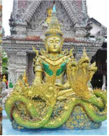
วัดรัตนเนตรดาราม

ใกล้เคียงน้ำตก ทางอุทยานแห่งชาติทับลาน ได้จัดสถานที่กางเต็นท์บนเนินเขาไว้บริการนักท่องเที่ยว ในกรณีที่น่าเดินเท้าไปเอง เสียค่าพื้นที่กางเต็นท์ ๓๐ บาท/คน/คืน เดินเท้าให้เข้าพักได้ ๒-๕ คน ราคา ๒๕๐-๕๐๐ บาท บ้านพักรับรอง ๑ หลัง ราคา ๑,๕๐๐ บาท จากจุดกางเต็นท์นี้สามารถมองเห็นน้ำตกและทิวทัศน์ที่สวยงามของอุทยานแห่งชาติได้