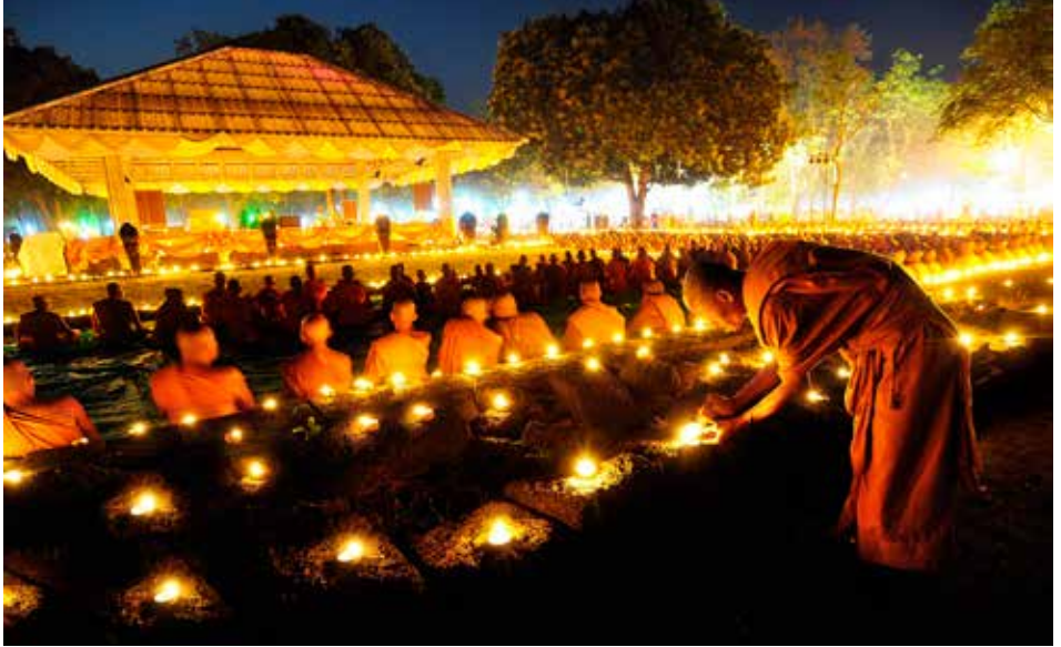
งานมาฆปุรณิมีศรีปราจีน