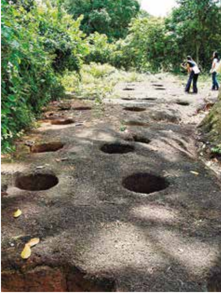
โบราณสถานหลุมเมือง

ขุดเจาะลึกลงไปในพื้นที่ศิลาแลง พระบาทสมเด็จพระจุลจอมเกล้าเจ้าอยู่หัวเสด็จประพาสเมื่อวันที่ ๑๘ ธันวาคม พ.ศ. ๒๔๕๑ มีพระราชสันนิษฐานว่า “เป็นหลุมสำหรับโบลกปูนที่จะปั่นลวดลายเครื่องประดับประดาปราสาท” มีหลุมทั้งหมดประมาณ ๔๘ หลุม แต่คำบอกเล่าของคนรุ่นเก่ากล่าวว่าเป็นหลุมสำหรับเล่นกีฬาพื้นบ้าน เรียกว่า “การเล่นหลุมเมือง”