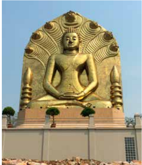
พระพุทธทวารวดีศรีปราจีน สิริธรโลกนาถ

น้ำตกเขาอีโต้ ตั้งอยู่ที่ตำบลบ้านพระน้ำตกเขาอีโต้