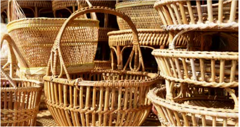
ศูนย์จำหน่ายผลิตภัณฑ์ไม้ไผ่

น้ำดื่มสมุนไพร ยาสมุนไพรรักษาโรคต่าง ๆ ผลิตและจำหน่ายในโรงพยาบาลเจ้าพระยาอภัยภูเบศร สอบถามรายละเอียดได้ที่ โทร. ๐ ๓๓๒๑ ๑๐๘๘ ต่อ ๒๑๓๗ เปิดบริการเวลา ๐๘.๓๐-๒๐.๓๐ น. สั่งซื้อทางไปรษณีย์ โทร. ๐ ๓๓๒๑ ๑๕๒๓