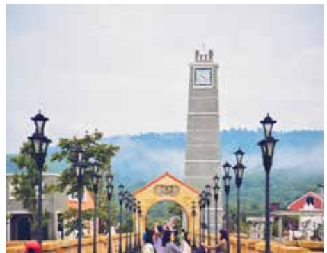
The Verona @ Tublan

The Verona @ Tublan ตั้งอยู่ในอำเภอนาดี จังหวัดปราจีนบุรี สถาปัตยกรรมตะวันตกได้แรงบันดาลใจมาจากเมืองเวโรนา แห่งแคว้นเวเนตโต้ ประเทศอิตาลี ตันกำเนิดนวนิยาย โรมีโอ&จูเลียต อันเลื่องชื่อของโลก ก่อกำเนิดดินแดนแห่งรักในเมืองไทย ท่ามกลางบรรยากาศขุนเขา ที่มีอากาศบริสุทธิ์อันดับ ๗ ของโลก ให้ความรู้สึกโรแมนติกด้วยการจำลองสะพาน Castelvecchio ทะเลสาบ Garda ลานกลางแจ้งแบบ Arena หอคอย Lamberti หอนาฬิกา หอระฆัง จัตุรัสเอร์เบกิจกรรมล่องเรือคอนโดล่า บ้านจูเลียต นั่งรถม้า สไตร์อิตาลี ชมฟาร์มสไตร์คันทรี่ บริการรถ ATV ขอปั้งสินค้าทั้งแบรนด์ไทยแบรนด์นอก ถึง ๑๒๐ ร้านค้า รวมทั้งมีบริการที่พัก โทร. ๐๙ ๖๓๒๔ ๔๘๒๓